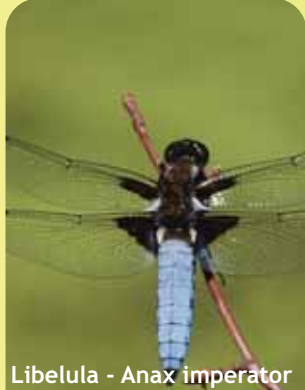
Libelula - Anax imperator